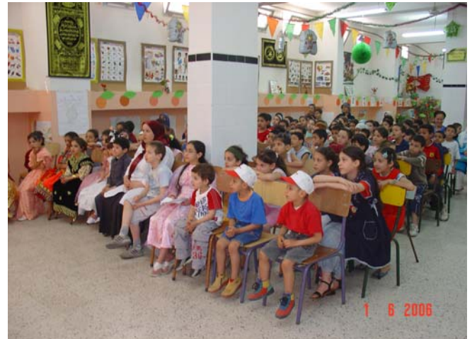
Elèves d'un club vert dans une classe