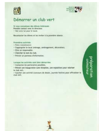
Démarrer un club vert