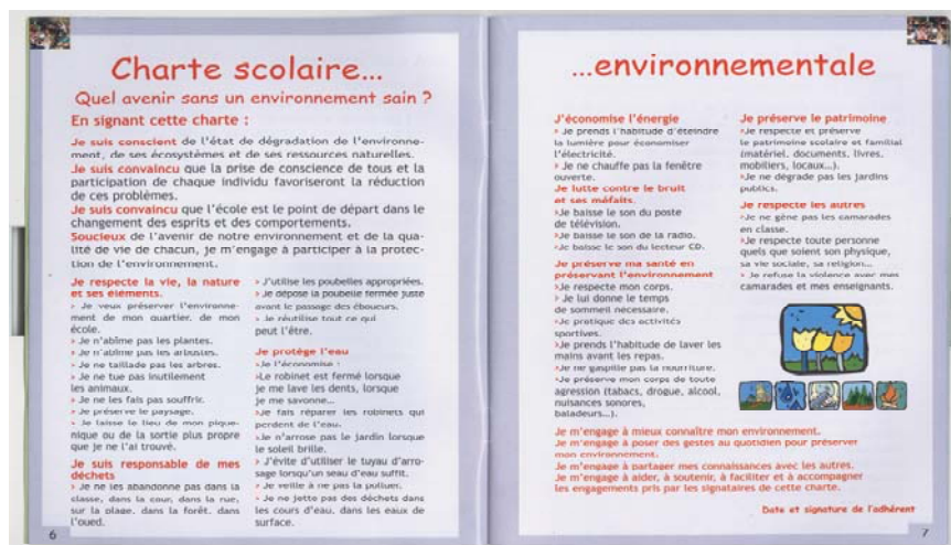
Charte scolaire environnementale

Ces acteurs par un acte solennel (signature de la charte) s'engagent à oeuvrer pour la protection de l'Environnement.