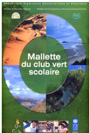
Mallette du club vert scolaire

Des fiches pédagogiques pour la préparation d'activités (valorisation de projets, préparation de sortie etc.....)