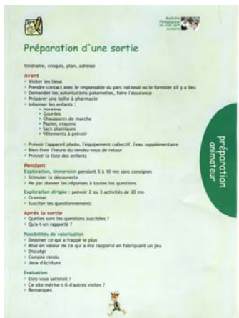
Préparation d'une sortie