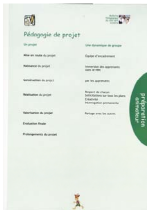
Pédagogie de projet